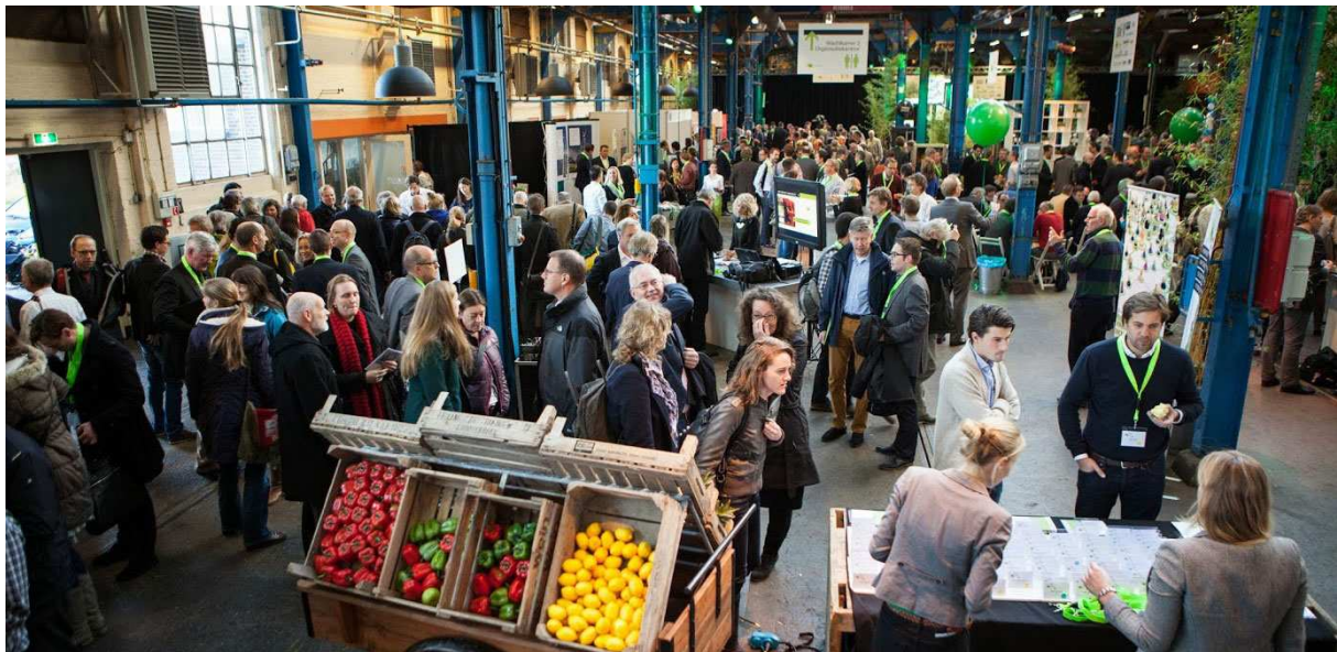
Landelijk evenement HIER opgewekt 15 november 2013