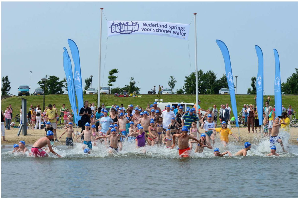
Big Jump 2013 Heerhugowaard, Strand van Luna